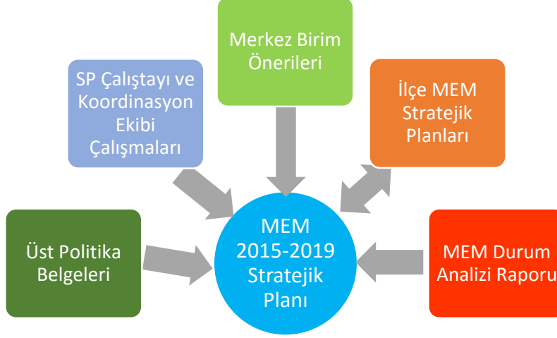
Şekil 1: Plan Oluşum Şeması

Stratejik plan temel yapısı Bakanlığımız Stratejik Planlama Üst Kurulu tarafından kabul edilen Bakanlık Vizyonu temelinde eğitimin üç temel bölümü (erişim, kalite, kapasite) ile paydaşların görüş ve önerilerini temel alır nitelikte oluşturulmuştur.